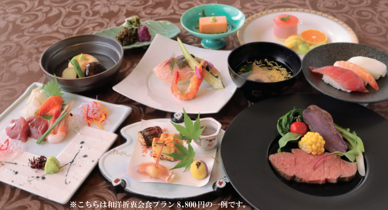
※こちらは和洋折衷会食プラン 8,800円 の一例です。